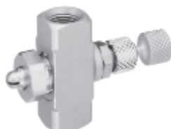
1/8" NPT или BSPT с запорной иглой