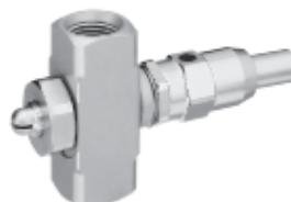
1/8" NPT или BSPT с очистительной иглой