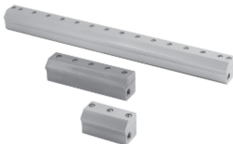
1/4" NPT или BSPT